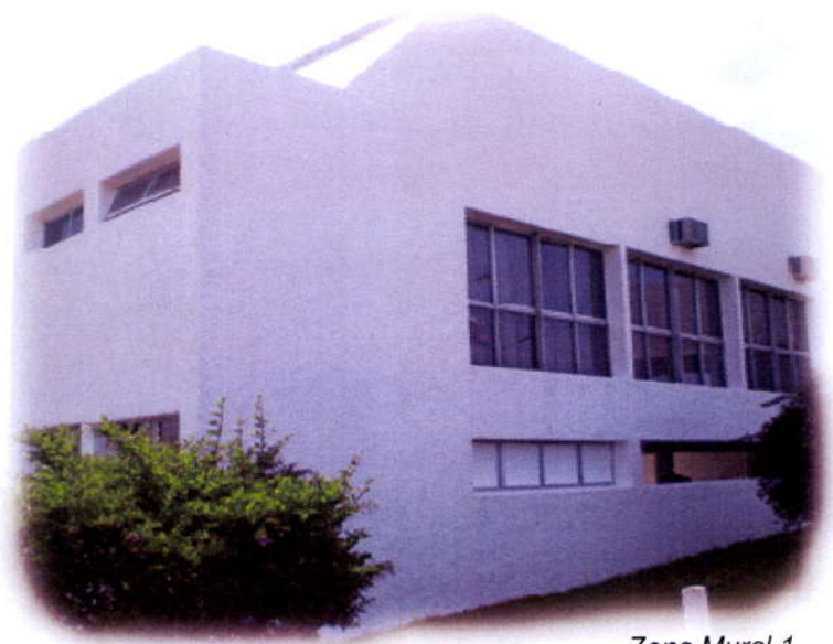
Zona Mural 1