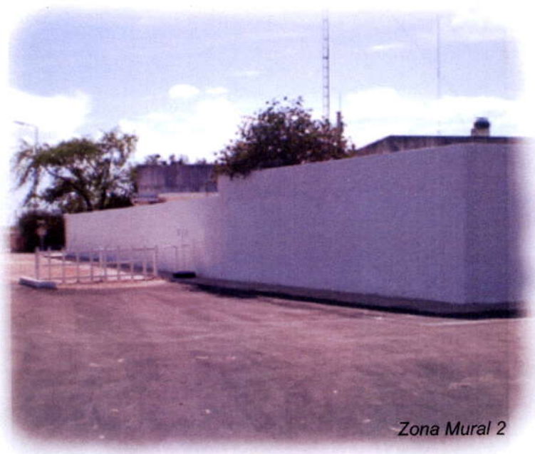
Zona Mural 2